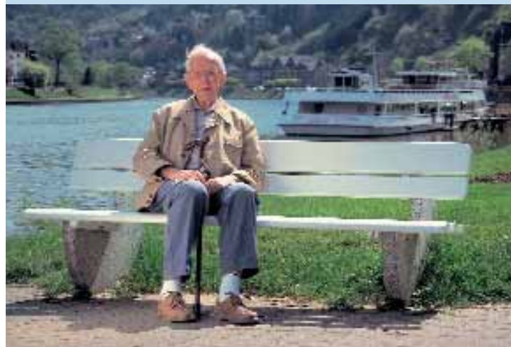
Die Seele baumeln lassen