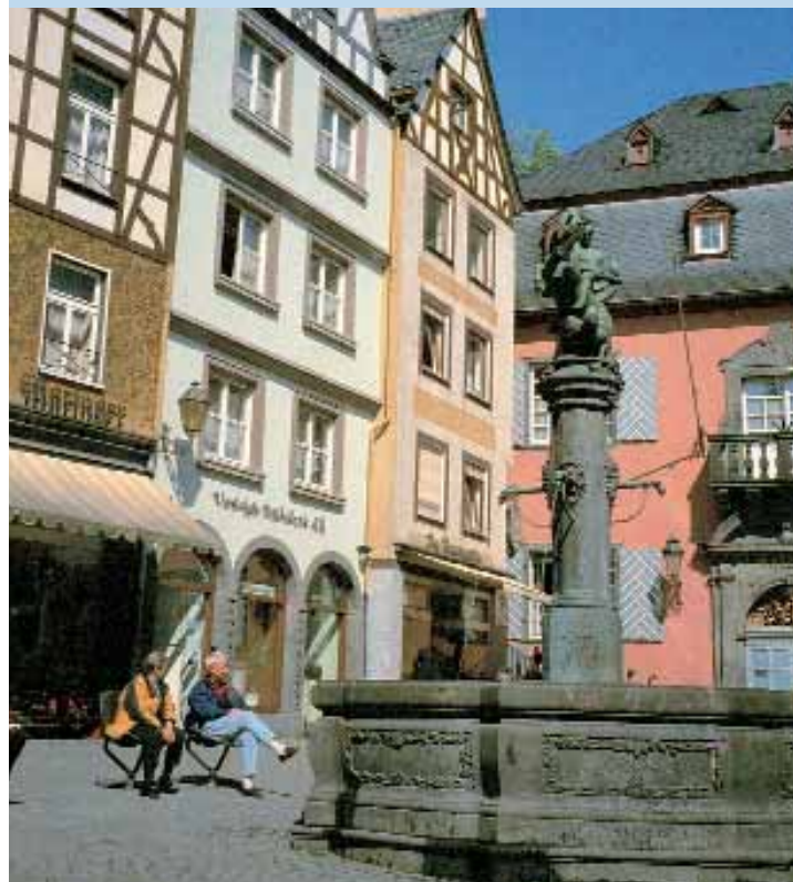
Die urige Altstadt von Cochem