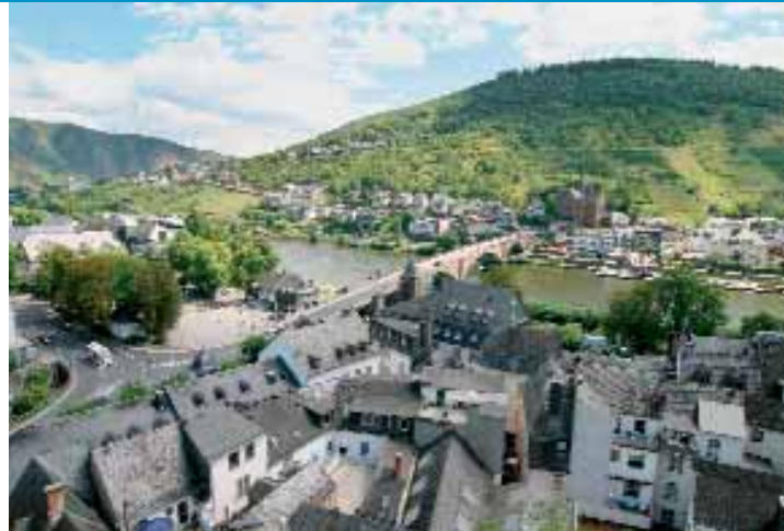
Panoramablick aus dem Fenster des Seniorenzentrums

In dieser traumhaften Lage bietet Ihnen das Seniorenzentrum St. Hedwig ein Zuhause zum Wohlfühlen. Auch Ihre Angehörigen und Besucher können sich auf einen erholsamen, interessanten und angenehmen Aufenthalt freuen!