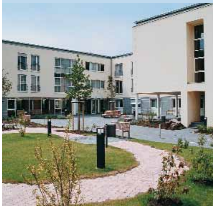
Seniorenstift St. Katharina, Treis-Karden

(Aus den Ordensleitlinien der Marienschwestern v.d.U.E.)